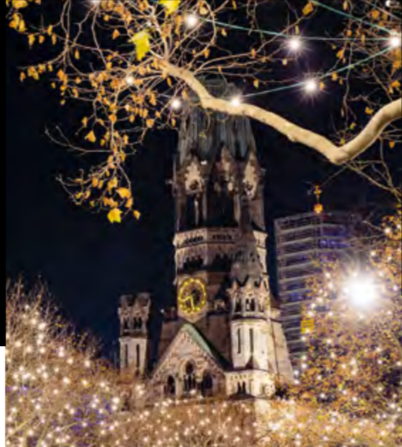
Berlin Kurfürstendamm 2019 realisiert mit 100.000 LED-Leuchtmittel der Type 58133.