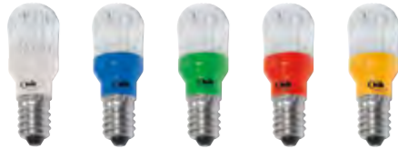
E14 Bulb klar · 5 LED · EEK: nkp.

Ideales Ersatzleuchtmittel für herkömmliche Glühbirnen in traditionellen E14 Motiven. Das Diamantschliff Polycarbonatkolben erzeugt ein brillantes Licht. Auch als Flash-Light und als RGB-Multicolor mit sanft fließendem Lichtwechsel erhältlich.