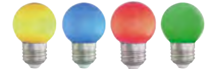
E27 Tropfen matt · Kunststoffkolben · IP20 7 LED · LD 10.000h, EEK: nkp

Ersatzlampen für Lichterketten und Weihnachtsbeleuchtung