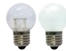
E27 Tropfen mit 7 LED · Polycarbonatkolben · EEK: nkp.

Bei Außenanwendung muss eine passende Fassung samt Silikon Dichtring verwendet werden.