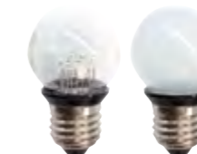
E27 Tropfen mit 9 LED · Polycarbonatgehäuse · EEK: nkp.

ECO Technology (erhöhter Powerfaktor, reduzierte Scheinleistung mit 1,15 VA); mit Kunststoffkolben, Kugelbirnenform mit schwarzer Fassung, ideal für marktübliche Lichterketten sowie zur Umrüstung von Weihnachts-Classic-Motiven