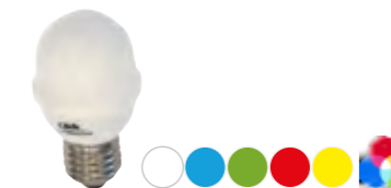
E27 GOLF BALL matt · mit 12 LED · Kunststoffkolben · EEK: nkp.

Polycarbonatkolben, widerstandsfähig und bruchstabil. Die konische Form des Sockels passt sich besonders gut dem Dichtungsring verschiedener, marktüblicher Fassungen an. Geeignet für den Innen- und Außenbereich.