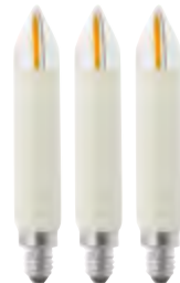
Filament LED Schaftkerze 3er Blister · mit Strombrücke