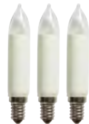
ROTPFEIL by MK Illumination Lichterketten Typ 963, 974 LED-Schaftkerze · 3er Blister