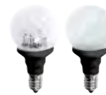
E14 Tropfen mit 8 LED · Polycarbonatgehäuse · EEK: nkp.

Ideal für die String Lite® 20. Die schwarze Zwischenfassung ist auf marktübliche schwarze Fassungen optimal abgestimmt.