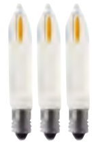
Filament LED Kleinschaftkerze 3er Blister · mit Strombrücke

LED Ersatzlampen für den Innen- und Außenbereich · mit elfenbeinfarbenem Schaft